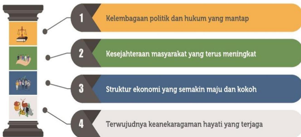
Gambar Empat Pilar RPJMN IV tahun 2020 - 2024

Rencana Pembangunan Jangka Menengah Nasional (RPJMN) 2020-2024 merupakan tahapan terakhir dari Rencana Pembangunan Jangka Panjang Nasional (RPJPN) 2005-2025. Terdapat 4 (empat) pilar dari RPJMN 2020-2024 untuk mencapai tujuan utama dari rencana pembangunan nasional periode terakhir, yaitu: